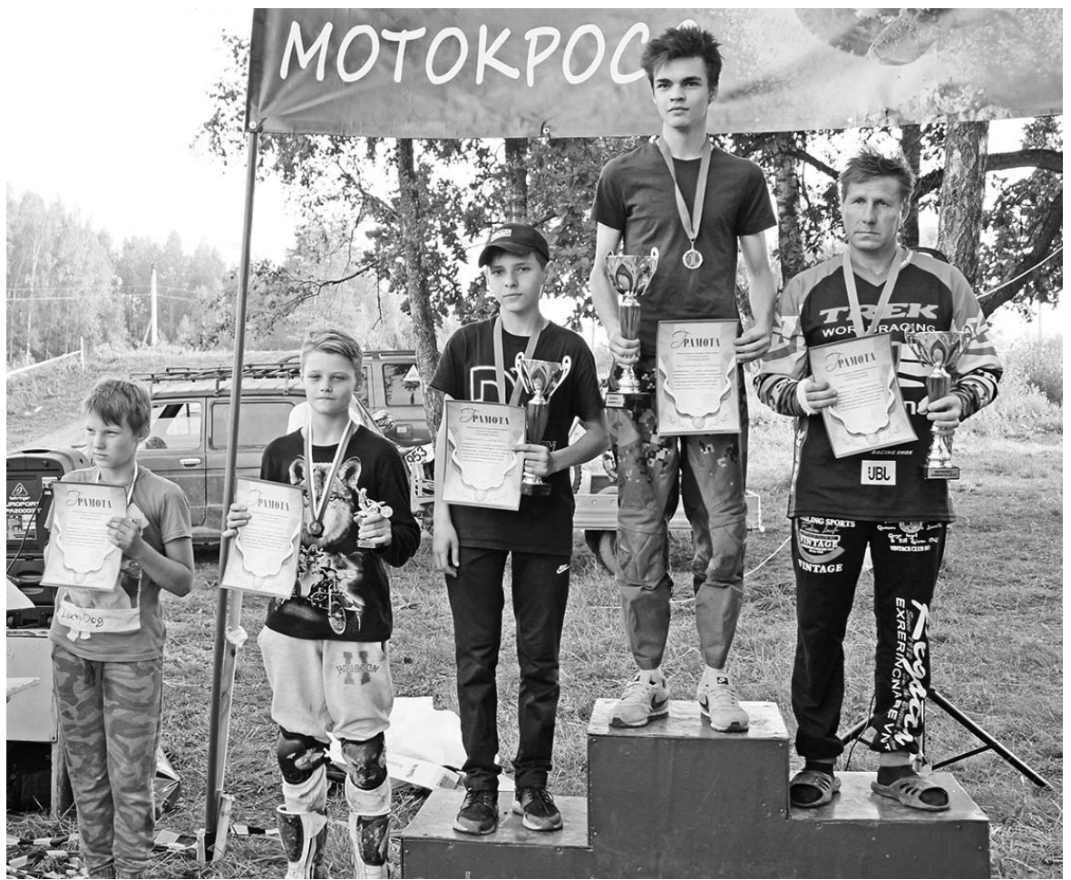
Лучшие в классе «Хобби».

Пришла пора для Open-1, и теперь уже я лучше приглядел-